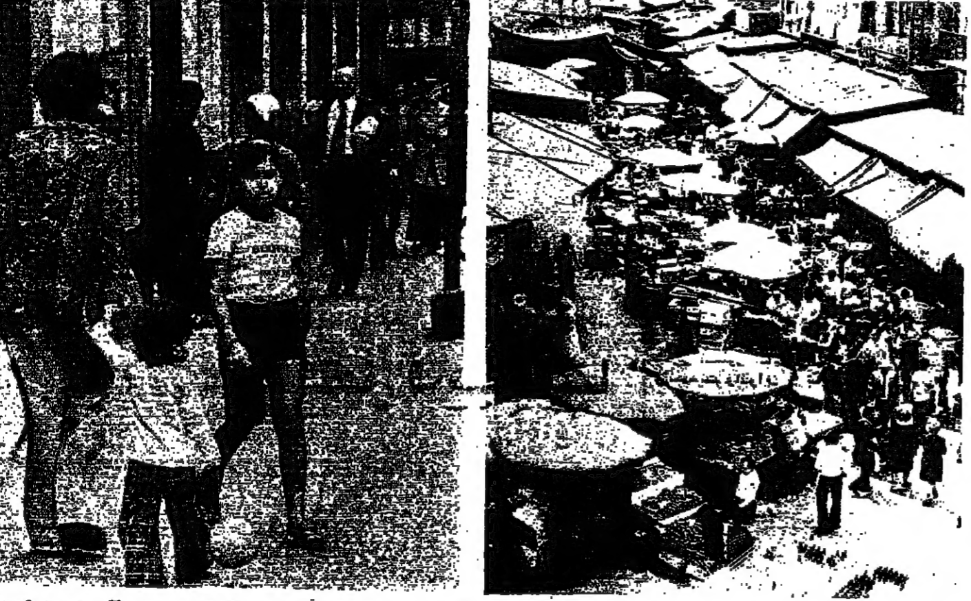
سوق الخضار في بيروت كما بدا بعد فتح الاسواق .. عودة جزئية الى الشوارع العامة في بيروت .. تصوير حكيم حنزا